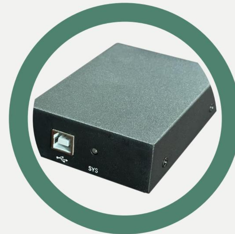
Čelní pohled USB port a Satus LED