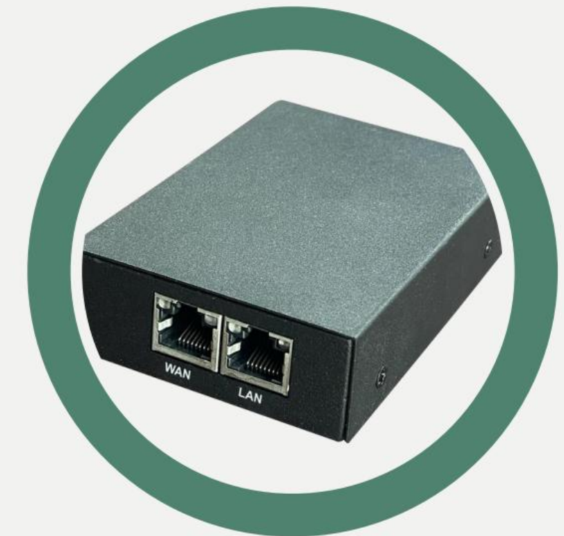
Zpětný pohled WAN a LAN